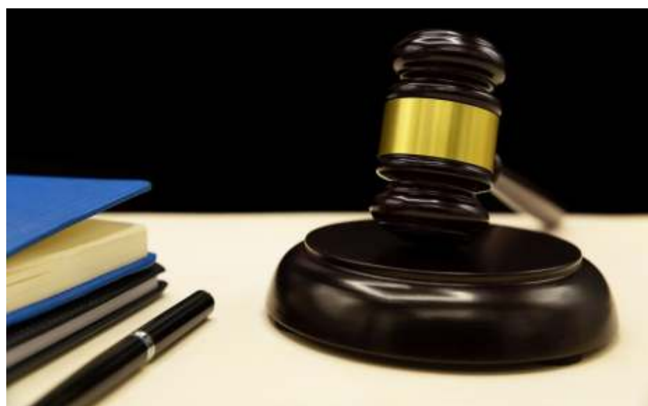
Justicia

El texto aborda la congestión de los despachos judiciales debido al alto volumen de expedientes y la falta de recursos financieros para incrementar el personal. Propone la creación de más despachos y juzgados exclusivos para acciones de tutela, así como el aumento del número de Magistrados en la Corte Consti-